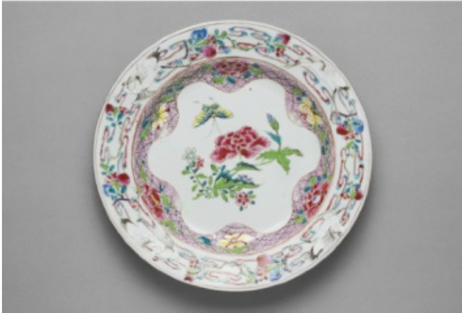
Plate , 1796-1820. Porcelain with overglaze enamel famille rose decoration. The Bloomfield Moore Collection, 1899. Accession Number 1899-699. Philadelphia Museum of Art, Philadelphia, Pennsylvania. https://philamuseum.org/collection/object/38368 .

reemplaza el motivo de Buda occidentalizado con símbolos de suerte, esperanza y empoderamiento.